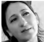
يقول: مبلجة مسلمان

وتشمل الإجراءات التي تم تنفيذها في السجون، بموجب أوامر بن غفير: تخفيض حصص الطعام والمياه إلى حد كبير، وإغلاق الخلال الصغيرة التابعة للسجون، والتي كان في إمكان المعتقلين شراء الأطعمة وغيرها من حاجتهم الضرورية منها، وقطع المياه والكهرباء، وتقليص كبير في الوقت المخصص لاستخدام المراحيض. إضافة