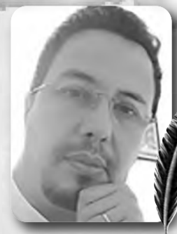
بقلم : حسان زهار