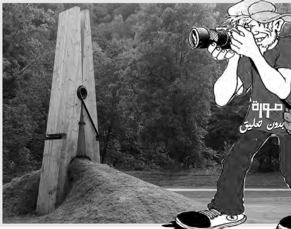
صورة بدون تعليق

وذكر أن كسوف الشمس يحدث في وضع الاقتران، وهذا يؤكد ميلاد هلال الشهر القمري الجديد، ويعتبر مركز الكسوف هو موعد ميلاد القمر الجديد، ويستدل بذلك التأكيد الحسابات الفلكية، وتتكرر ظواهر كسوف الشمس وخسوف القمر بشكل سنوي في مناطق لتختلف من العالم، وسوف تشهد المنطقة العربية كسوفا كليا للشمس في أوت 2027.