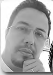
بقلم : حسان زهار